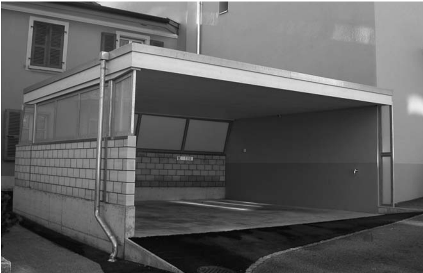
Wie aus einer anderen Welt.