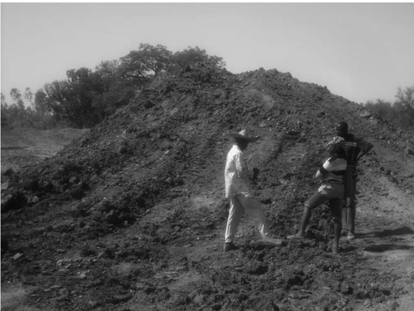
Die bewässerte Erde wurde zum Standort der Mauer transportiert, die eine Höhe von 5 m erreichen wird. Die Bevölkerung beteiligt sich an gewissen Arbeiten und beobachtet mit Interesse den Fortschritt der Arbeiten, die im April abgeschlossen sein dürften. Die Einweihung ist im August vorgesehen, wenn das Bassin gefüllt ist.