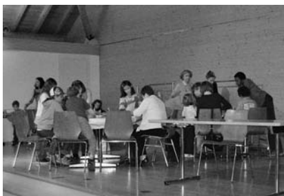
Es wird gebastelt.

2010 fand der Weihnachtsverkauf des Frauenvereins eine Woche früher statt als üblich. Bis zum letzten Moment wurde fieberhaft gewerkelt. Ob kleinere Geschenke, Gestecke oder Adventskränze – es war für Jede oder Jeden etwas dabei. Wie gewohnt konnte man nach dem Kauf in der Kaffeestube Kontakte pflegen.