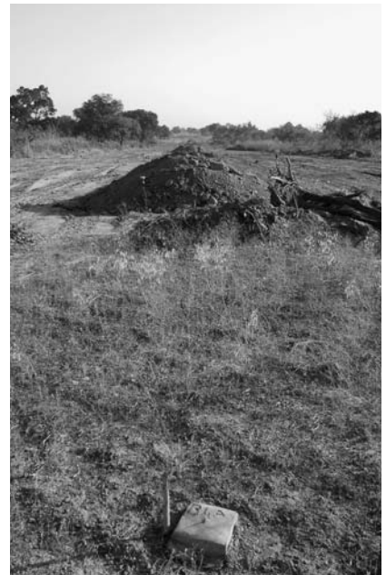
Die Markierungspfosten der Geometer erlauben dem Bauunternehmer der Staumauer, diese gemäss den Plänen der Ingenieure zu errichten.