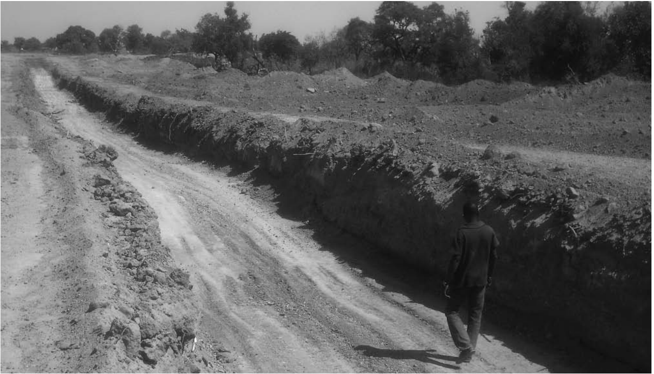
Ein über 400 m langer Graben wurde für die Verankerung der zukünftigen Staumauer ausgehoben.

Die Staumauer von Toézouri befindet sich seit Dezember 2010 im Bau. Die Einwohnerinnen und Einwohner von Leubringen und Magglingen sind Ende April zu einer Präsentation dieses für Toézouri sehr wichtigen Projektes eingeladen.