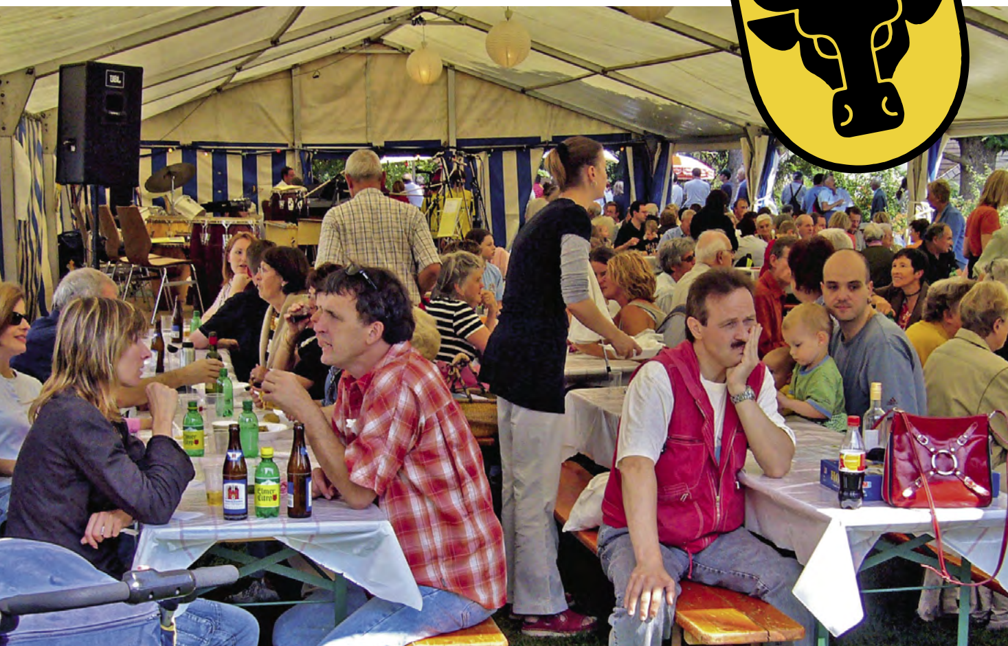
La grande tente, un point de rencontre incontournable lors de la fête du village de l'année 2006.