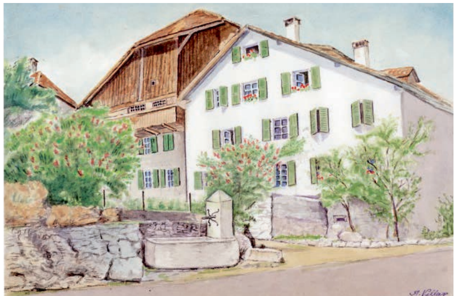
Aquarelle de A. Villars.