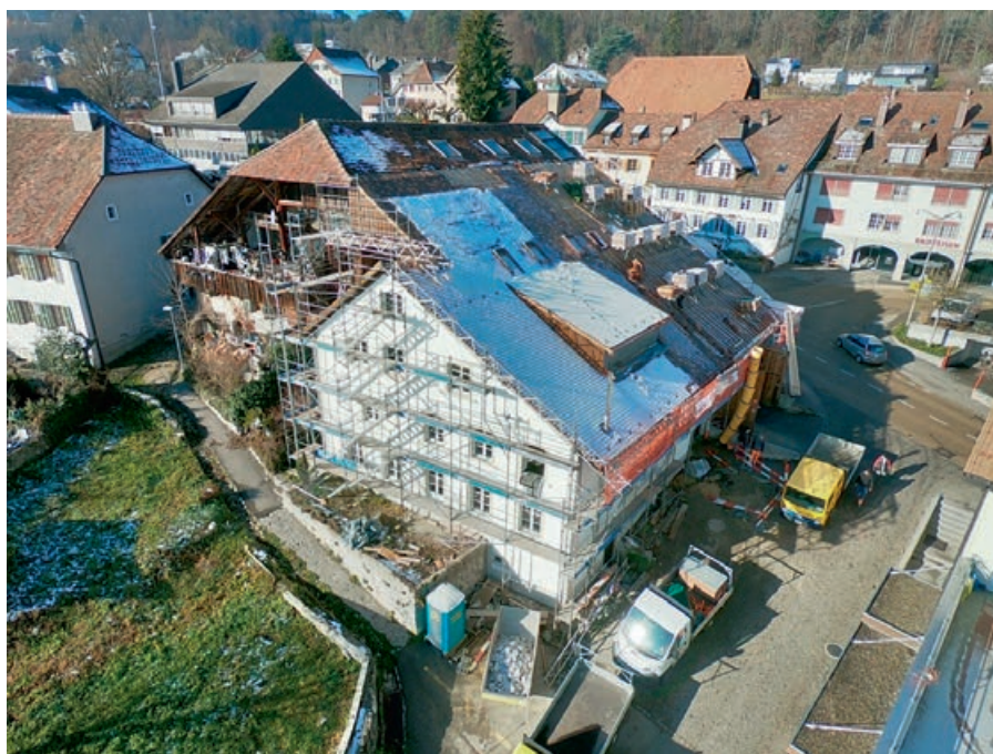
Rénovation du toit avec sa nouvelle lucarne.

Les escaliers en bois ont été remplacés par un escalier métallique et une fenêtre ainsi que six petites lucarnes ont été ajoutées à la façade Nord-Est.