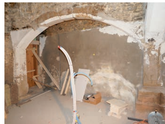
Vestiges de l'ancienne cuisine du 17 ème siècle.

Ce bâtiment fait partie du patrimoine historique du centre du village d'Evilard. C'est un emplacement stratégique pour lequel