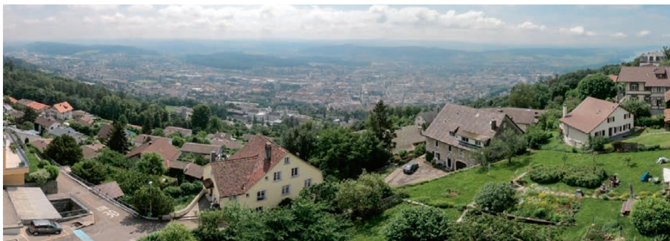
Vue sur la ville de Bienne et le Seeland.