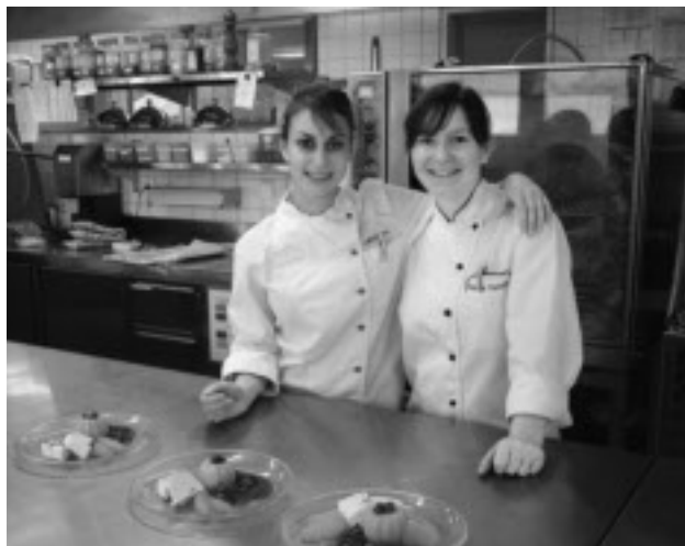
Une alimentation saine est la clé pour une vie en bonne santé.