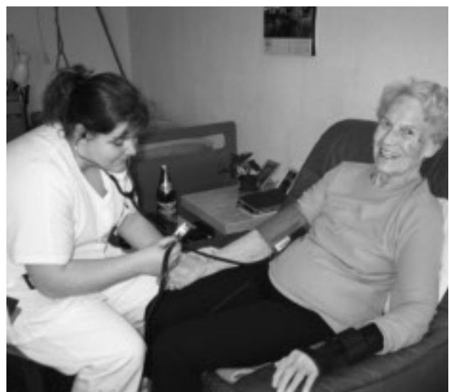
Für die meisten von uns wird sie einmal nötig – die Pflege.