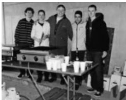
Les juniors du FC Evilard ont mis les saucisses sur le grill et versé les boissons.