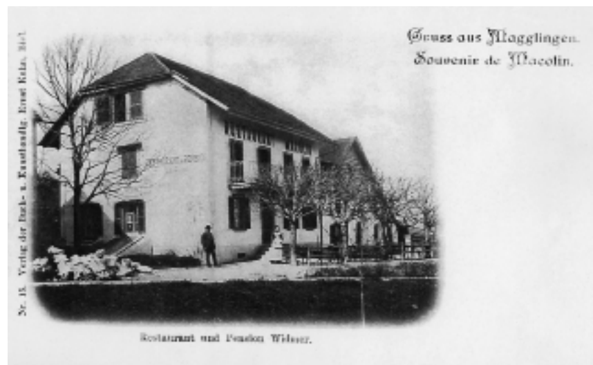
Pension Widmer, après des Alpes, après Vieux-Suisse.