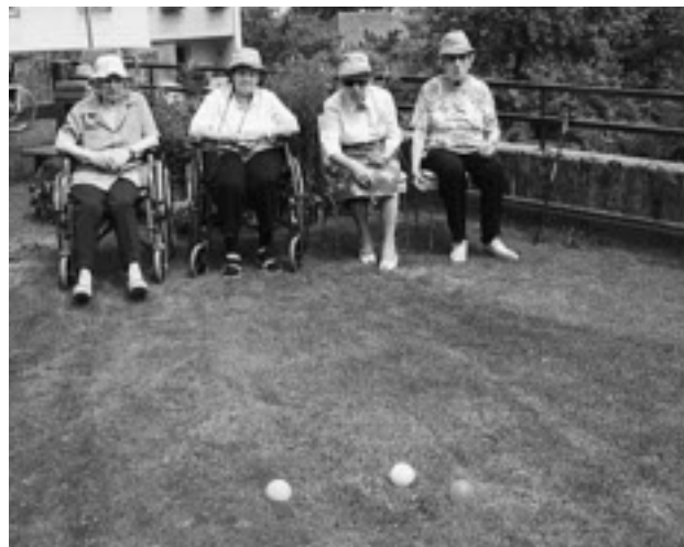
Spielerische Aktivitäten sogar im Rollstuhl.

Spitäler 2007 übernommen. So wurde in unserer Region der kommunale Spitalverband als Träger des Spitalzentrums Biel, an dem unsere Gemeinde beteiligt war, Ende 2007 aufgelöst. Seit 1909 war das Spital Biel ein Bezirks-, später Regionalspital, das von rund 50 Gemeinden der Region gemeinsam getragen wurde.