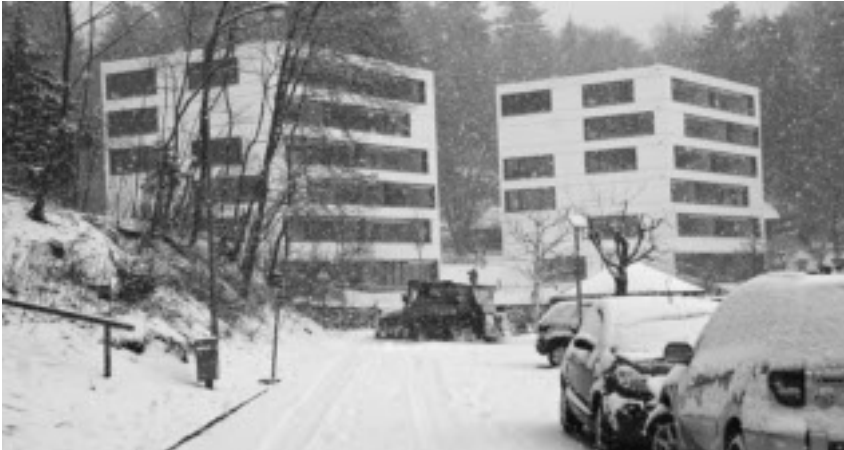
Die zwei markanten Wohnblocks präsentierten sich trotz Frühlingsanfang noch einmal im Winterkleid.

Die Genossenschaft bonacasa® Beau-Site organisierte am 6. März einen Promotionsanlass, der trotz misslichem Wetter viele Besucher in die neue Altersresidenz Beau-Site lockte. Mit musikalischen Unterhaltungen, Clowns, einer eindrücklichen Fotoausstellung über alt Leubringen – Grundlage eines Besucherwettbewerbs – sowie einem Restaurationsbetrieb wurde der Anlass zu einer eigentlichen Einweihungsfeier.