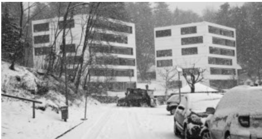
Malgré les prémices du printemps, les deux immeubles se présentent encore une fois dans leur habit d'hiver.

La coopérative bonacasa® Beau-Site a organisé le 6 mars une journée promotionnelle qui a attiré, malgré le temps maussade, de nombreux visiteurs dans la nouvelle résidence pour seniors. L'événement, agrémenté par de la musique, des clowns, une exposition impressionnante de photos sur l'Evilard de jadis et un concours à ce sujet, s'est transformé en une véritable fête d'inauguration, avec une offre de restauration adéquate.