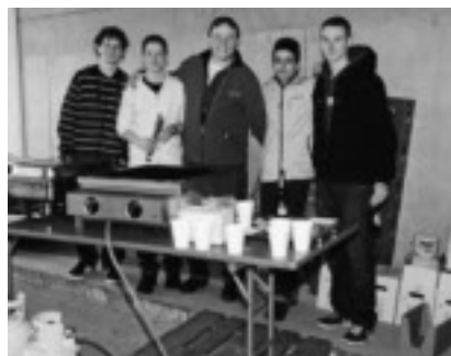
Junioren des FC Leubringen grillten Bratwürste und schenkten Getränke aus.