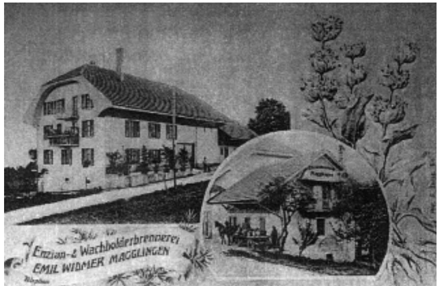
La maison Gerber était une distillerie.