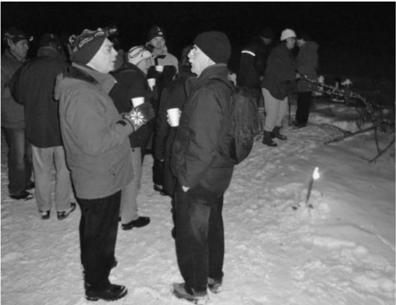
Randonnée hivernale nocturne sur les hauteurs de la Montagne-de-Douanne. Apéro en plein air avant la fondue dégustée au restaurant.