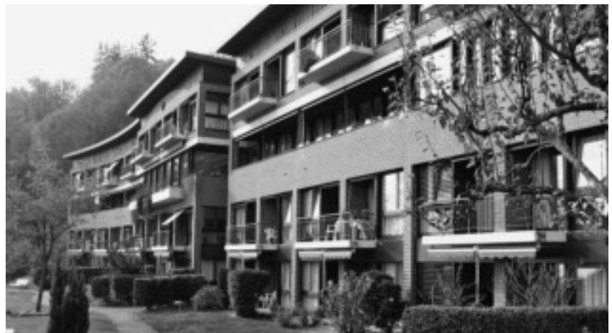
Das Alters- und Pflegeheim La Lisière – eine der ganz wichtigen Institutionen in der Gemeinde im Gesundheitssystem.

Der Gesundheitszustand der Schweizer Bevölkerung war noch nie so gut wie heute. Die Herausforderungen für die Zukunft sind jedoch zahlreich und sehr anspruchsvoll. Unser Gesundheitswesen gehört zu den teuersten der Welt und das System stösst an seine Grenzen. Zu dessen Entlastung ist zukünftig eine stärker auf Gesundheitsförderung und Prävention ausgerichtete, ganzheitliche Gesundheitspolitik angezeigt. Alle Gesundheitsakteure, auch in unserer Gemeinde, sind gefordert, innovative Beiträge zu leisten. Nur so lässt sich das Vertrauen der Bevölkerung in das Gesundheitswesen langfristig erhalten.