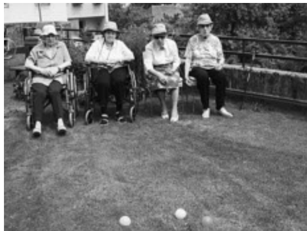
Se déplacer en chaise roulante n'empêche pas de participer aux activités ludiques.

publics financés auparavant par les communes. Par la suite, l'Association communale des établissements hospitaliers, soit l'organe responsable du centre hospitalier de Biemme et dont notre commune a fait partie, a été dissolue en 2007. Depuis 1909 ce centre de soins a tout d'abord été un hôpital du district, puis un hôpital régional relevant de la responsabilité d'une cinquantaine de communes de la région.