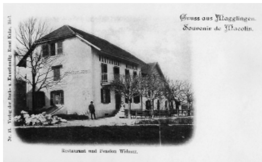
Pension «Widmer», dann «Des Alpes», dann «Alter Schweizer».