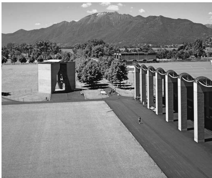
Le CST: une entreprise florissante.