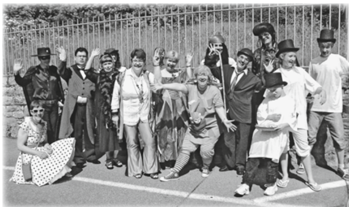
Le personnel en costumes de personnages du cinéma.