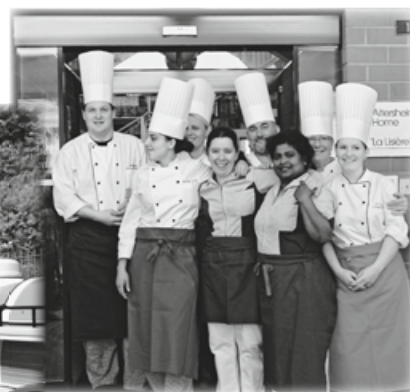
Beaucoup d'éloges pour l'équipe de la cuisine.