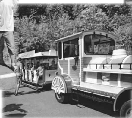
Tour de ville à Evilard.