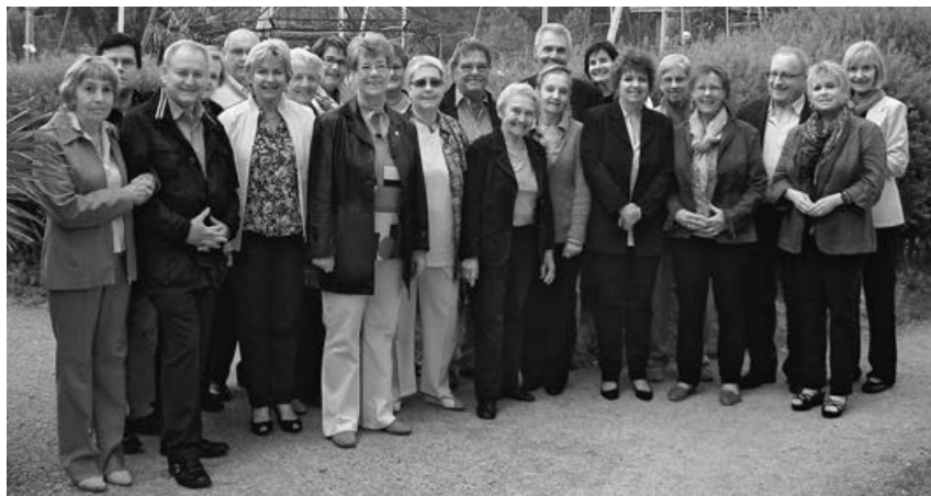
Les bénévoles du café à La Lisière à l'occasion d'un dîner commun à Bienne.

Environ 25 bénévoles s'engagent au café du home La Lisière. Ils procurent du plaisir et de la diversité dans le quotidien des pensionnaires. Ils régaler les jeunes et les aînés durant les 365 après-midi de l'année.